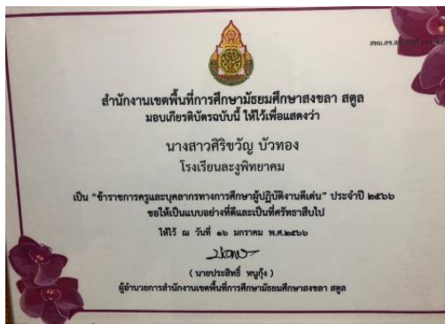
ข้าราชการครูและบุคลากรทางการศึกษาผู้ปฏิบัติงานดีเด่น ประจำปี 2566