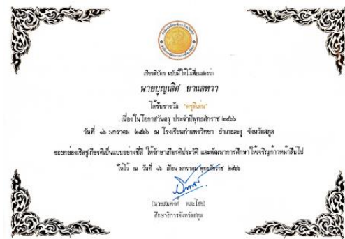
ครุฑดีเด่น เนื่องในโอกาสวันครู ประจำปีพุทธศักราช 2566