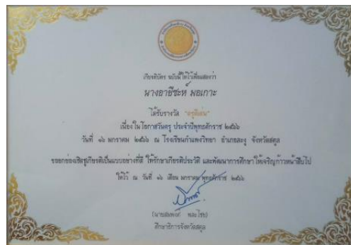
ครุฑดีเด่น เนื่องในโอกาสวันครู ประจำปีพุทธศักราช 2566