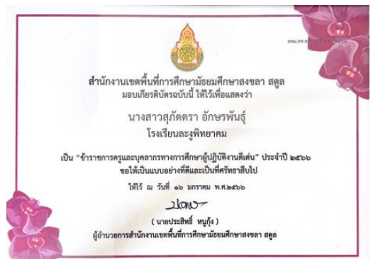
ข้าราชการครูและบุคลากรทางการศึกษาผู้ปฏิบัติงานดีเด่น ประจำปี 2566