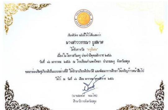
ครูดีเด่น เนื่องในโอกาสวันครู ประจำปีพุทธศักราช 2566