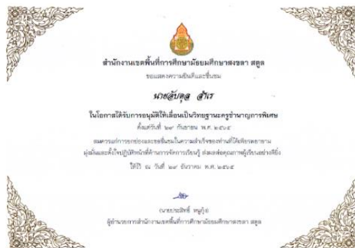
ได้รับการอนุมัติให้เลื่อนเป็นวิทยฐานะครูชำนาญการพิเศษ