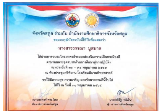
อบรมโครงการสร้างและส่งเสริมความเป็นพลเมืองดีตามรอยพระยุคลบาทด้านการศึกษาศูการปฏิบัติ